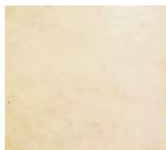
P_k - pomiar „końcowy” wykonany po serii zabiegów