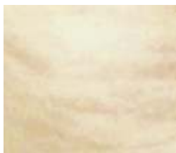
P_0 - pomiar „zerowy” wykonany przed serią zabiegów;